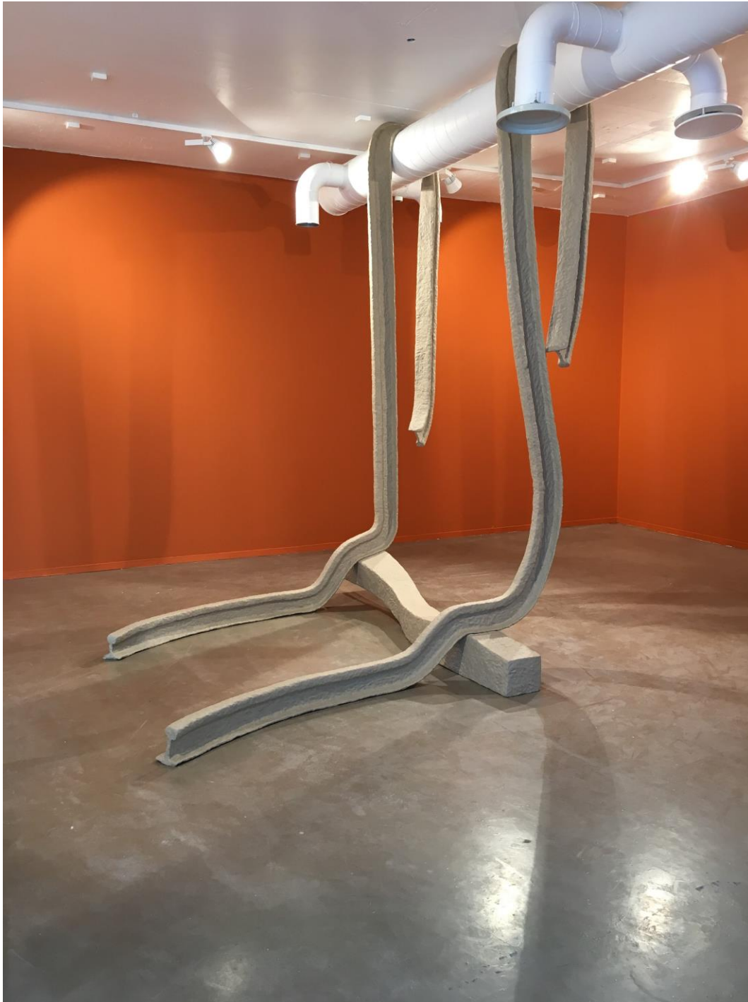
Karin Blomgren, Transit (2018), Bodø kunstforening